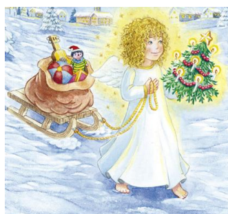
Das Christkind - kein kleines Jesulein, sondern eine engelhaftige Phantasiegestalt

Im 16. Jhdt. kam es zu einer entscheidenden Wende. Martin Luther wollte den Schwerpunkt weg vom heiligen Nikolaus und auf Christus selbst lenken. Er schlug vor, dass nicht mehr der Nikolaus, sondern der „Heilige Christ“ die Geschenke bringt –