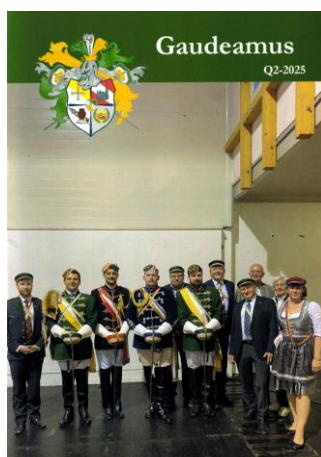
Gaudeamus heute Ausgabe 2/2025

die Umstellung auf Herstellung der Druckvorlagen mit Hilfe eines Computers, zuvor war das viele Jahre mit einer Schreibmaschine erledigt worden. Von 2000 bis 2018 lag die Redaktion in den Händen von Wolfgang Lettl, der begann, die Hefte auch farbig zu gestalten und für seine