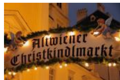
Christkindlmärkte erfreuen sich zunehmender Beliebtheit

Das Fest ist ein Mosaik aus Geschichte, Religion und Kultur, das sich immer wieder neu erfindet und doch seinen Kern bewahrt: Hoffnung, Licht und Gemeinschaft.